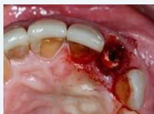
Diente fracturado #22