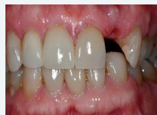
12 semanas después de la extracción